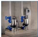
Montaż pionowy w komorze suchej

Pompy SE z płaszczem chłodzącym umożliwiają montaż w komorze suchej wymaganej przez wiele gałęzi przemysłu.