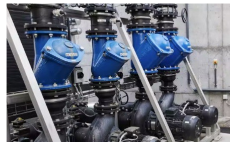
Instalacja pomp NB firmy Grundfos do pompowania ścieków przemysłowych.

2. Pompy z wlotem osiowym firmy Grundfos do pompowania ścieków przemysłowych (np. NBG/NKG) montuje się w komorze suchej.