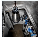
Pionowy montaż na mokro na autozłączu