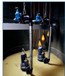
Pionowy montaż na mokro ze złączem hakowym