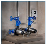
Montaż poziomy w komorze suchej