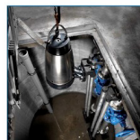
Vertikální ponorná instalace na automatické propojovací soustavě