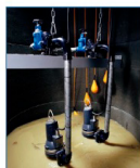
Vertikální ponorná instalace na „připojenou“ sestavu