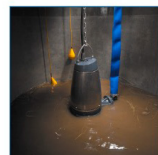
Vertikální ponorná instalace na kruhovém podstavci

Instalace čerpadel Grundfos SE/V, SL/V, SEG pro čerpání průmyslových odpadních vod.