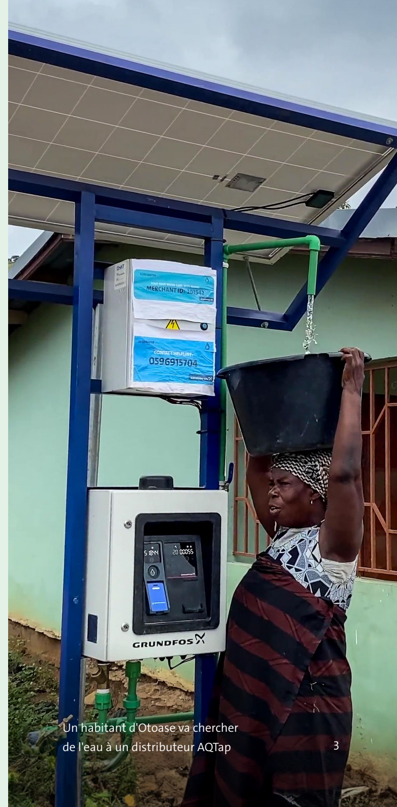
Un habitant d'Otoase va chercher de l'eau à un distributeur AQTap