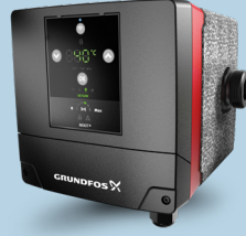
Grundfos MIXIT 25-10