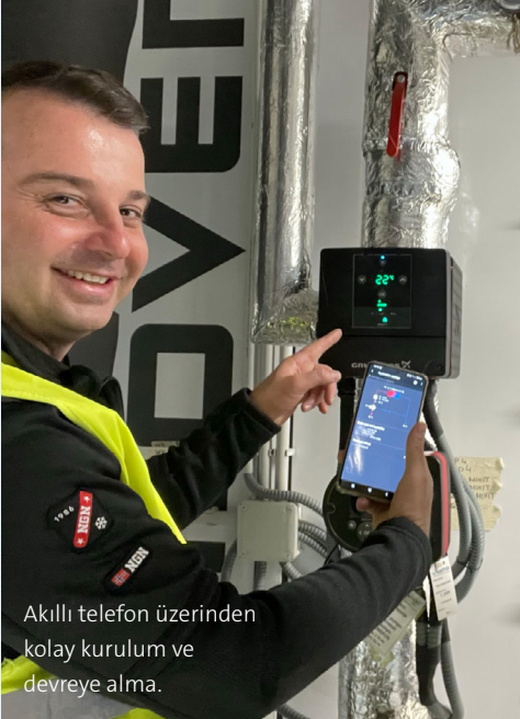
Akıllı telefon üzerinden kolay kurulum ve devreye alma.

Bundan sonraki altı ay boyunca, bir dizi Grundfos MAGNA3 pompa ve MIXIT kontrol