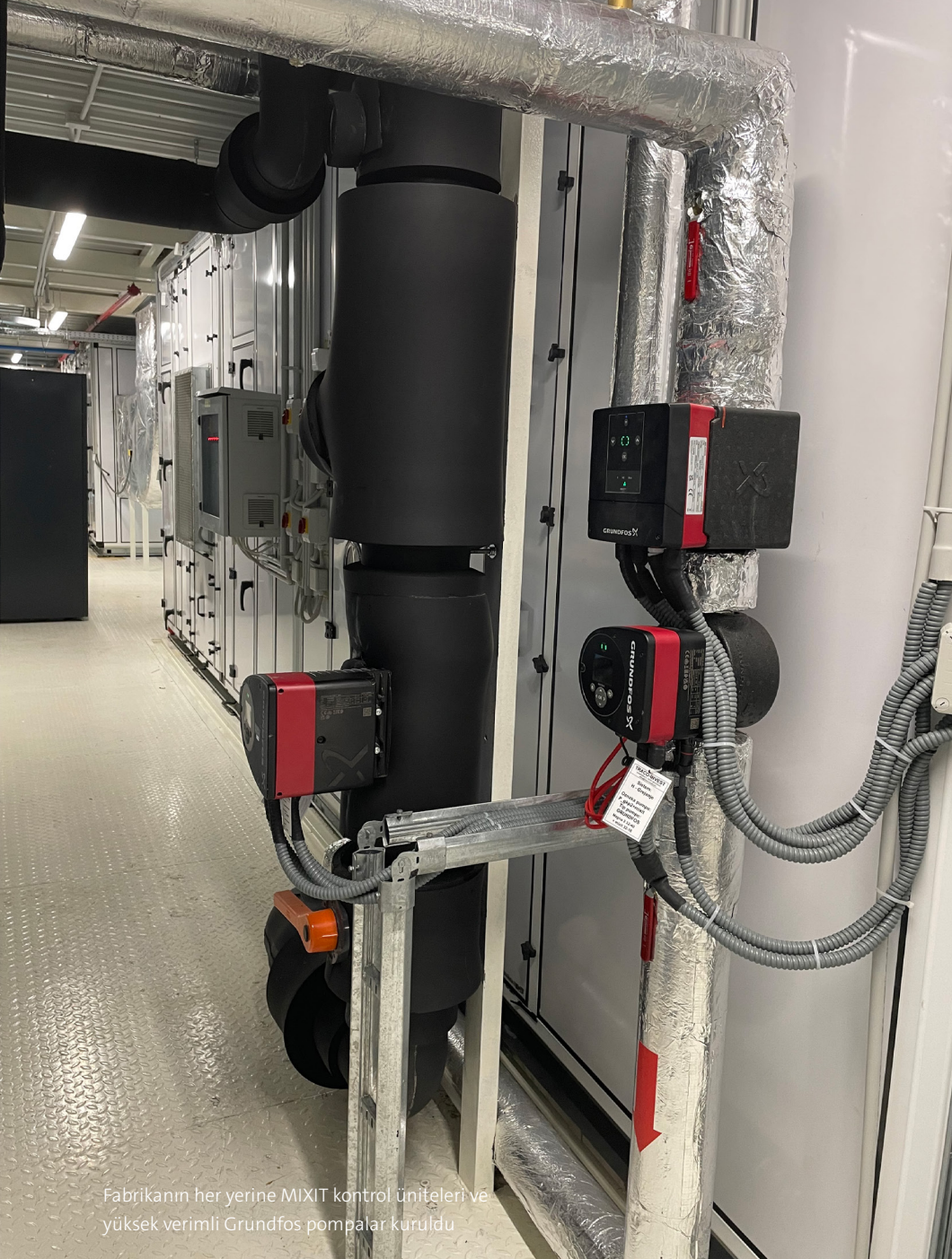
Fabrikanın her yerine MIXIT kontrol üniteleri ve yüksek verimli Grundfos pompalar kuruldu

Grundfos MIXIT, binaların enerji verimliliğini artıran hepsi bir arada bir karıştırma devresi çözümdür. Sırbistan'ın Indjija kentindeki Grundfos fabrikasındaki bir genişletme projesi için MIXIT, mevcut BYs'ye kolay ve sorunsuz bir şekilde entegre edilerek MIXIT ve Grundfos MAGNA3 pompalardan gelen çeşitli parametreler üzerinde tam kontrol sağladı. Genişletilen fabrika, Grundfos'un su ve enerji tüketimini azaltmayı içeren sürdürülebilirlik hedeflerini karşılayan LEED Gold sertifikasına sahip.