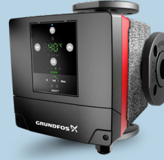
Grundfos MIXIT 32-16