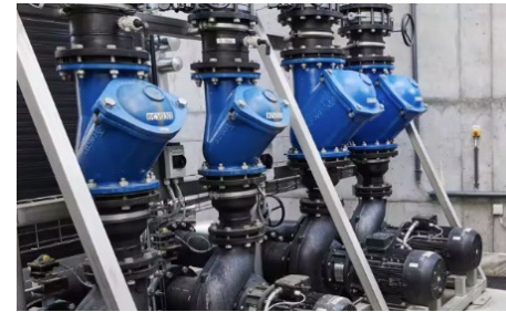
Grundfos-Pumpen der NB-Baureihe zur Förderung von Industrieabwasser

2. Normpumpen von Grundfos zur Förderung von Industrieabwasser (z. B. NBG/NKG) sind trocken aufgestellte Pumpen.